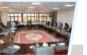
ديوان مجلس النواب يبحث الاستعدادات لانعقاد المؤتمر البرلماني الإفريقي