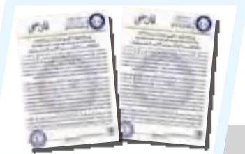
الحكومة الليبية تؤكد تشديد الإجراءات بشأن الهجرة غير الشرعية ومكافحة التوطين