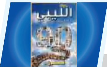
تسعون عدداً من العطاء الثقافي.. مجلة "الليبي" تواصل حضورها بثبات