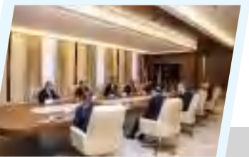
المهندس بالقاسم حفتر يستقبل وفداً بريطانياً ويطلعهم على مشاريع إعمار درنة