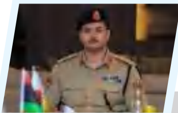
10 ملايين دينار لبطل النوري.. مبادرة من الفريق خالد حفتر لدعم الكرة الليبية

وأوضح النوري، في كلمة موجهة إلى الشعب الليبي نقلتها وكالة الأنباء الليبية، أن ليبيا تلتزم بالقيم الإنسانية ومبادئ القانون الدولي، لكنها ترفض في الوقت ذاته أي ترتيبات أو سياسات تمس سيادتها الوطنية أو تؤثر على تركيبها السكانية.