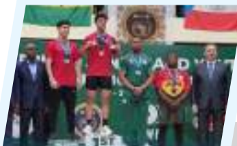
إنجاز تاريخي للربيع محمد الشارف في الأفريقية للشباب والناشئين

عقدت هيئة رئاسة مجلس النواب، ممثلة في رئيس مجلس النواب المستشار عقيله صالح، والنائب الأول فوزي النويري، والنائب الثاني مصباح دومة، اجتماعاً موسعاً مع محافظ مصرف ليبيا المركزي ناجي عيسى ونائبه مرعي البرعصي، وذلك بمقر ديوان مجلس النواب في مدينة بنغازي. تناول الاجتماع ملف الإصلاحات الاقتصادية وتطوير السياسة النقدية، حيث تعهد محافظ المصرف بإنهاء أزمة السيولة في الأول من أكتوبر القادم، مشيراً إلى جهود منظمة لتفعيل وتطوير الدفع الإلكتروني. وقدم مصرف ليبيا المركزي خلال اللقاء مقترحات تهدف إلى معالجة عدد من المخبثات، مع تأكيد مجلس النواب على دعمه الكامل لهذه التوجهات بهدف تجاوز العقبات وتعزيز الاستقرار المالي. ناقش الاجتماع قضية التضخم الناتج عن منح الاعتمادات دون ضوابط واضحة أو موازنة استيرادية، والتأكيد على ضرورة الالتزام بالصراف ضمن بنود الميزانية العامة وعدم تجاوزه إلا بقانون. وفي ختام اللقاء، شددت رئاسة مجلس النواب على أهمية توحيد المؤسسات على مستوى البلاد، واستمرار العمل المشترك في دعم جهود الإعمار والبناء في مختلف المناطق.