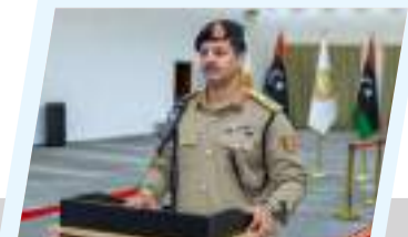
رئيس الأركان العامة يؤدي اليمين القانونية أمام القائد الأعلى للقوات المسلحة