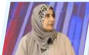
مؤتمر اللسانيات الجنائية.. اللغة والعدالة في زمن التحول الرقمي