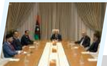
ملف الإعمار يتصدر مباحثات رئيس مجلس النواب ومحافظ مصرف ليبيا المركزي ونائبه