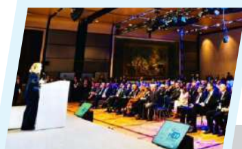
رئيس لجنة الشؤون الخارجية يختتم مشاركته في منتدى البحر المتوسط