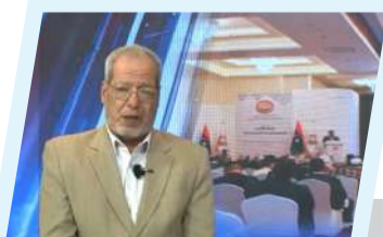
المصالحة الوطنية.. التحدي الأكبر في تاريخ ليبيا الحديث