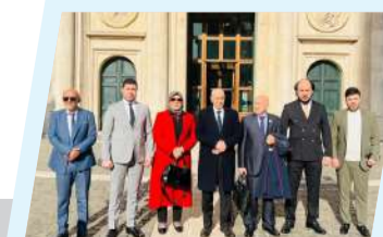
رئيس مجلس النواب يصل إلى إيطاليا بناءً على دعوة رسمية من البرلمان الإيطالي