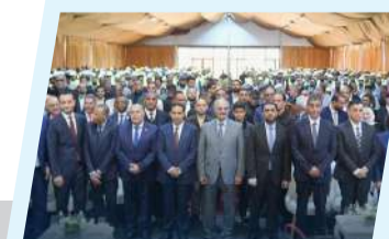
القائد العام للقوات المسلحة ورئيس الحكومة يدشن مشروع استكمال 20 ألف وحدة سكنية ببنغازي