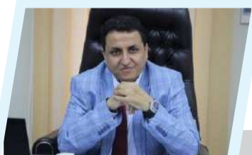
رئيس لجنة إدارة هيئة التأمين الطبي، هيئة التأمين الطبي مختصة بالتأمين على المهنة الطبية